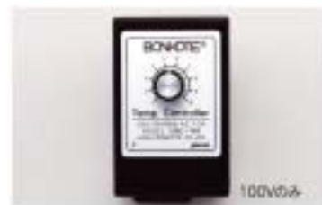
電圧スライド式温度調節器 CRC-150 こての電源プラグを接続すれば10段階の簡易温度調節ができます。2芯・3芯 共用タイプ(100V仕様SRタイプに接続可)