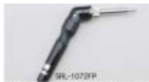
L型グリップも特別に製作出来ます。

この度は、ボンコートはんだごて「SRシリーズ」をお求め頂き誠にありがとうございます。 ご使用になる前に、この説明書をお読みにになり、正しくご使用下さるようお願い致します。